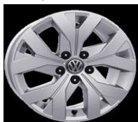
Легкосплавные диски «Moscow» 6.5 J x 16, стандартно для Trendline