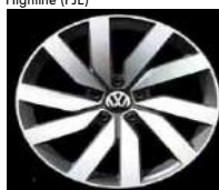
Легкосплавные диски «Marseille» Volkswagen R, 8 J x 18, опционально для Comfortline и Highline (P1E)