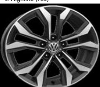
Легкосплавные диски «Soho» 7 J x 17, опционально для Comfortline и Highline (P15)