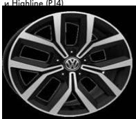
Легкосплавные диски «Nivelles» 7 J x 17, опционально для Comfortline и Highline (P14)