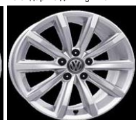
Легкосплавные диски «London» 7 J x 17, стандартно для Highline