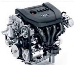
БЕНЗИНОВЫЙ ДВИГАТЕЛЬ 2.0 МОЩНОСТЬЮ ДО 142 Л.С.