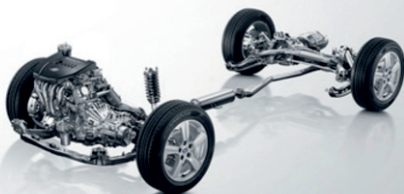
УСОВЕРШЕНСТВОВАННАЯ КОНСТРУКЦИЯ ПОДВЕСКИ