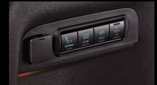
Пульт управления электроскладыванием третьего ряда сидений