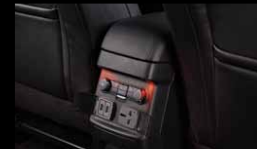
Блок трехзонного климат-контроля и розеток для задней части салона

В путешествиях большими компаниями незаменимым станет третий ряд сидений с электроскладыванием. Пульт управления, расположенный в багажнике, позволяет с легкостью сложить и разложить сиденья, отдав предпочтение увеличению пассажироместности или увеличению грузового отсека.