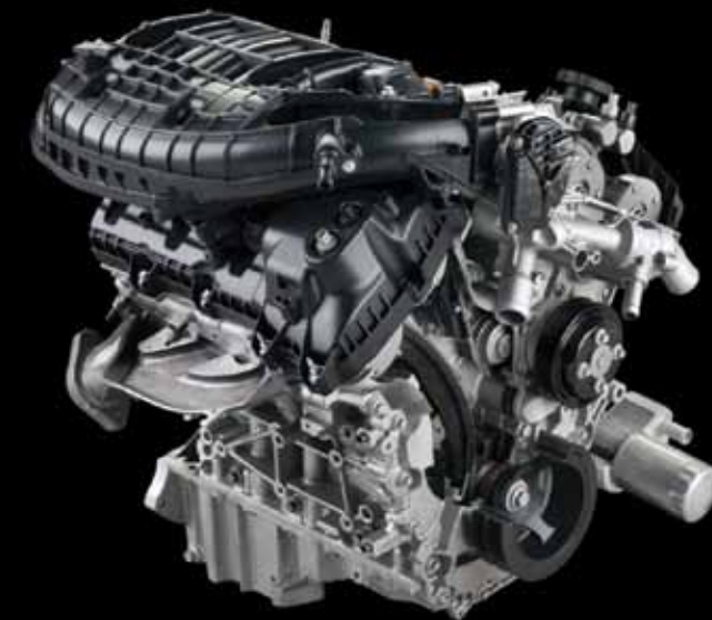
Двигатель Cyclone 3.5 л 249 л.с. Ti-VCT

Внушительный крутящий момент в 346 Нм позволит снова и снова наслаждаться мощными ускорениями в городе и на трассе, а возможность заправляться бензином АИ-92 позволит уверенно путешествовать по России без необходимости тщательно выбирать проверенные заправочные станции и сократить расходы на топливо.