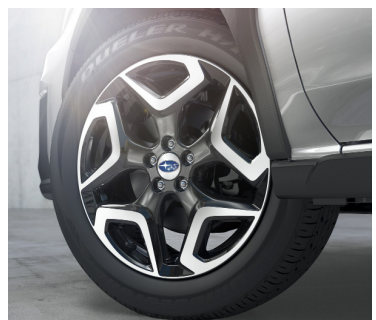
18" легкосплавные диски