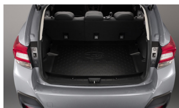
Поддон в багажный отсек