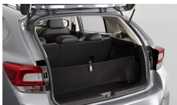
Вертикальная сетка в багажник