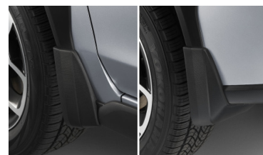
Комплект передних и задних брызговиков