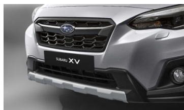
Защитная накладка на передний бампер