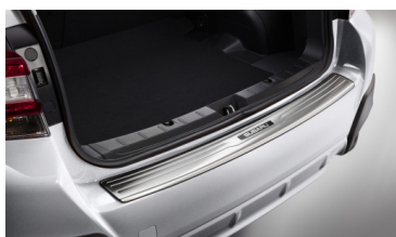
Стальная накладка на порог багажника