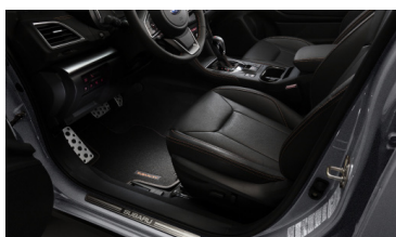
Комплект текстильных ковров