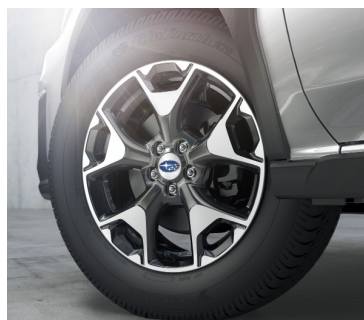
17" легкосплавные диски